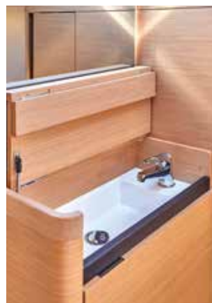
◀ Private sink (optional) Meuble vasque privatif (option) Privates Waschbecken (option) Mobiletto privato (opzionale) Mueble de aseo privado (opcional)