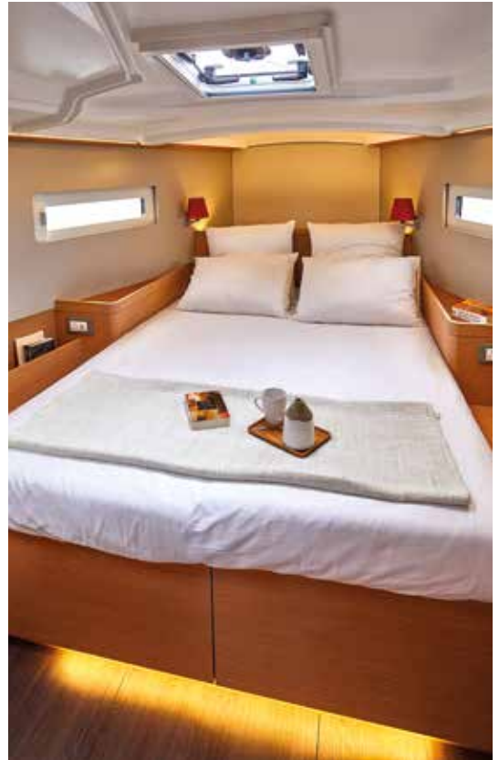
▲ High standard master cabin Cabine propriétaire de haut standing Eignerkabine mit hohem Standard Cabina propietario de alta gama Lussuosa cabina armatoriale