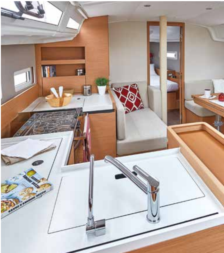
▲ A great central U-shape galley, very functional Une grande cuisine centrale en U, très fonctionnelle Eine grandiose Pantry in U-Form, sehr funktionell Una gran cocina central en forma de U, muy funcional Una grande cucina centrale a forma di U, molto funzionale