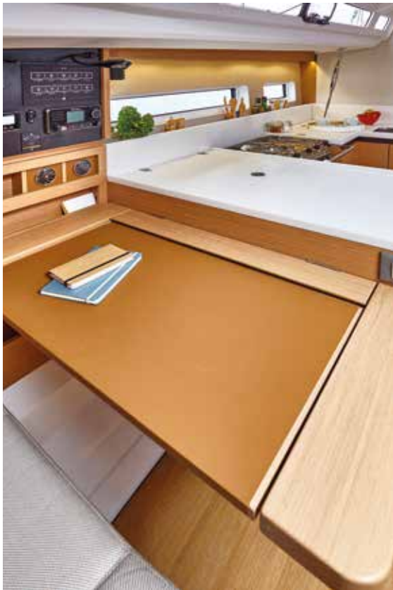
▲ Real chart table Belle table à carte Großer Kartentisch Tarjeta hermosa mesa a carta Bel tavolo da carteggio